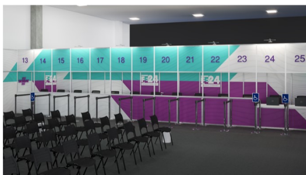
Foto 1 - Referência meramente ilustrativa de estande Caex.